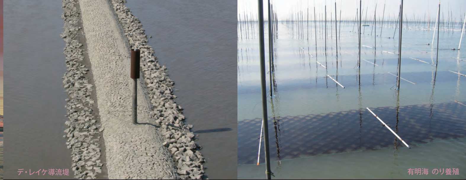
デ・レイケ導流堤